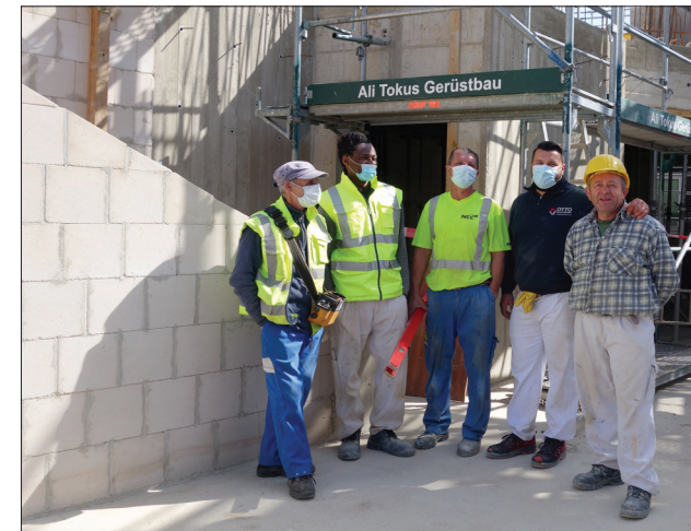
Für die Bauarbeiter ist der große Bau mit seinen vielen gerundeten Mauern durchaus eine Herausforderung. Mit Recht sind sie stolz auf ihre Arbeit.