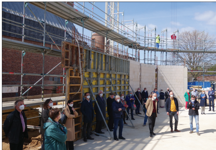
Corona-mäßig verteilen sich die Gäste mit Masken und Abstand. Zum ersten Mal bekommen wir einen Eindruck von Form und Größe des geplanten Raumes.