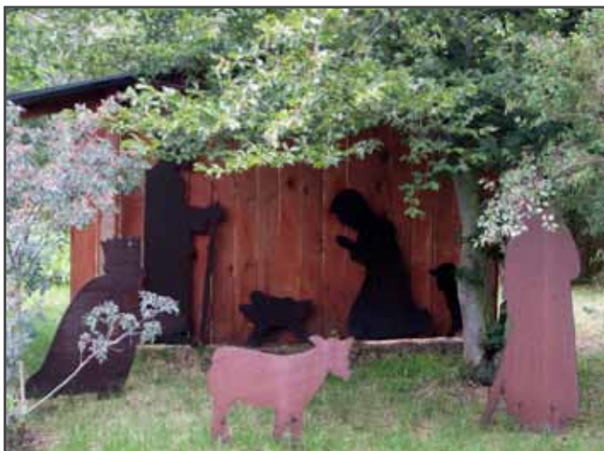
Bibelgarten in Ribbeck

in Auftrag gegeben. Die für März 2020 terminierte Veröffentlichung wurde kurzfristig abgesagt, da noch äußerungsrechtliche Bedenken bestünden. Am 29.10.2020 dann der Paukenschlag: das nachgebesserte Gutachten werde endgültig nicht veröffentlicht, da es wissenschaftlichen Ansprüchen nicht genüge. Es soll ein neues Gutachten erstellt werden, das im März 2022 veröffentlicht werden soll. Zwischenzeitlich hat das Bistum Aachen ein entsprechendes Gutachten derselben Anwaltskanzlei veröffentlicht, ohne dass es zu „äußerungsrechtlichen“ Problem gekommen ist. Verständnis für das Kölner Vorgehen fällt da schwer. Davon, dass einer der vom Kölner Gutachten betroffenen Kleriker angedroht hätte, gegen die Veröffentlichung vorzugehen, ist nichts bekannt. Bischof Heße aus Hamburg hat lediglich gefordert, die Studie „nur im Paket“ mit seiner Darstellung zu veröffentlichen.