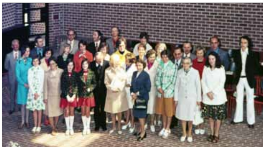
Der Kirchenchor St. Norbert im Mai 1975

Traurig macht es uns, dass wir trotz intensiver Bemühungen keinen Sängernachwuchs bekamen. So schlossen wir uns im Jahr 2005 mit dem Cäcilienchor in Trills zusammen, dem es ähnlich wie uns ging. Und so erlebten wir noch einmal eine Vielfalt im Singen und klangvolle Kirchenmusik.