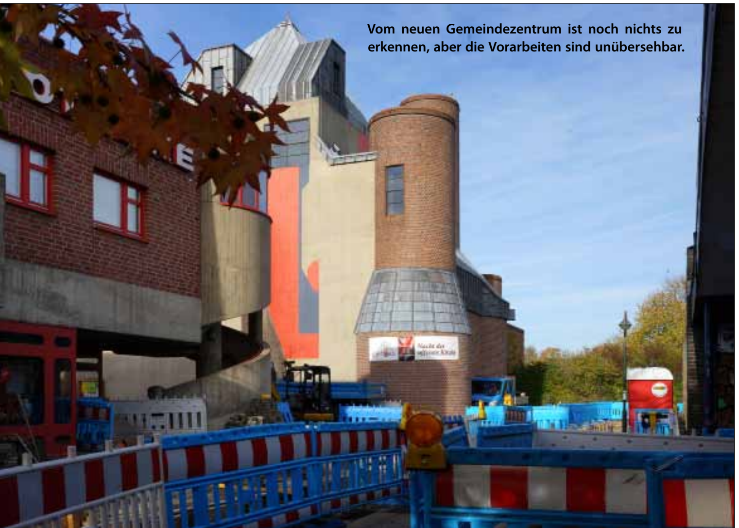
Vom neuen Gemeindezentrum ist noch nichts zu erkennen, aber die Vorarbeiten sind unübersehbar.

JoH: Johannes-Haus Carlo-Schmid-Straße Hellerhof