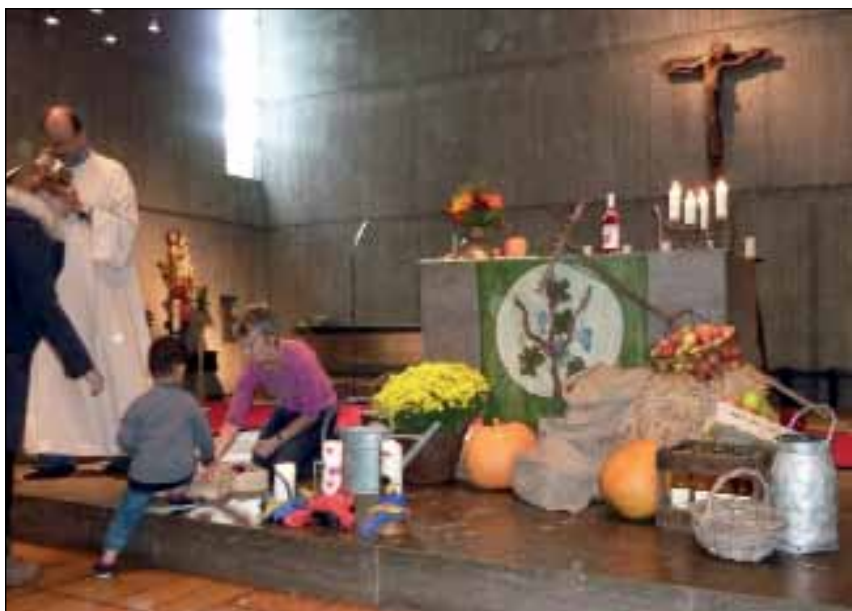
Erntedank-Gottesdienst der Kita in St. Theresia

Stell dir vor, EIN STERN erstrahlt UND DU bist schuld.