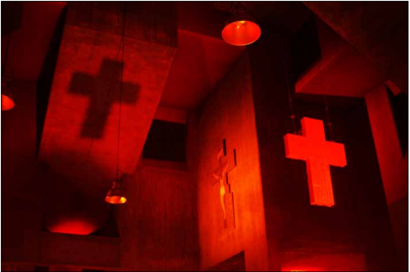
Offene St. Matthäus-Kirche im November 2012

Was ist Glaube, der Glaube an Gott? Eine Frage, die gar nicht so leicht zu beantworten ist. Glaube ist – wie die Liebe und die Hoffnung – nicht sichtbar, nicht greifbar. Und doch gibt es ihn. Man kann Glauben erfahren, aber nicht lernen. Glauben zu können ist eine Gnade, ein Geschenk Gottes. Er ist auch durch sogenannte gute Werke nicht zu erwerben. Wenn Glauben nun ein Geschenk ist, heißt das nicht, dass ich dafür nicht mehr tun muss als das Geschenk anzunehmen. Ich muss mich schon mit ihm beschäftigen, mir Zeit für ihn nehmen, mich um ihn bemühen, auch um den Glauben beten.