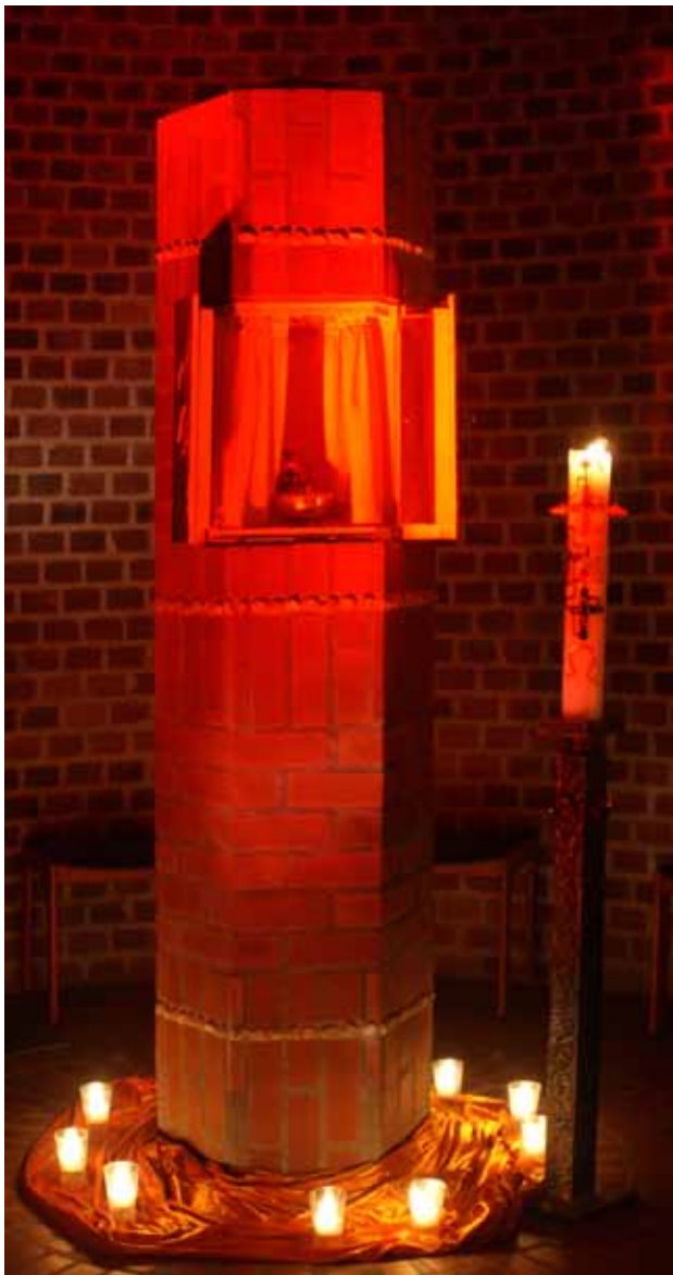
Offene St. Matthäus-Kirche – der Tabernakel