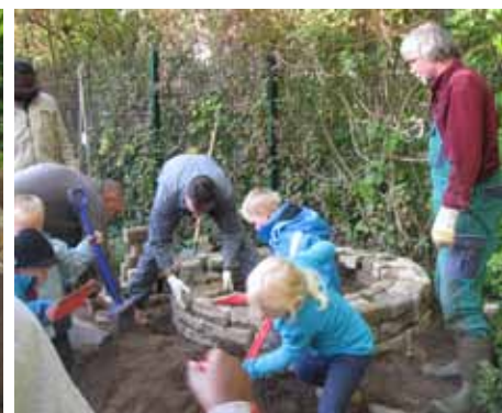
Kinder-Väter-Aktionstag im Herbst: Sie bauen gemeinsam eine Kräuterschnecke... und freuen sich auf das Bepflanzen im Frühjahr.